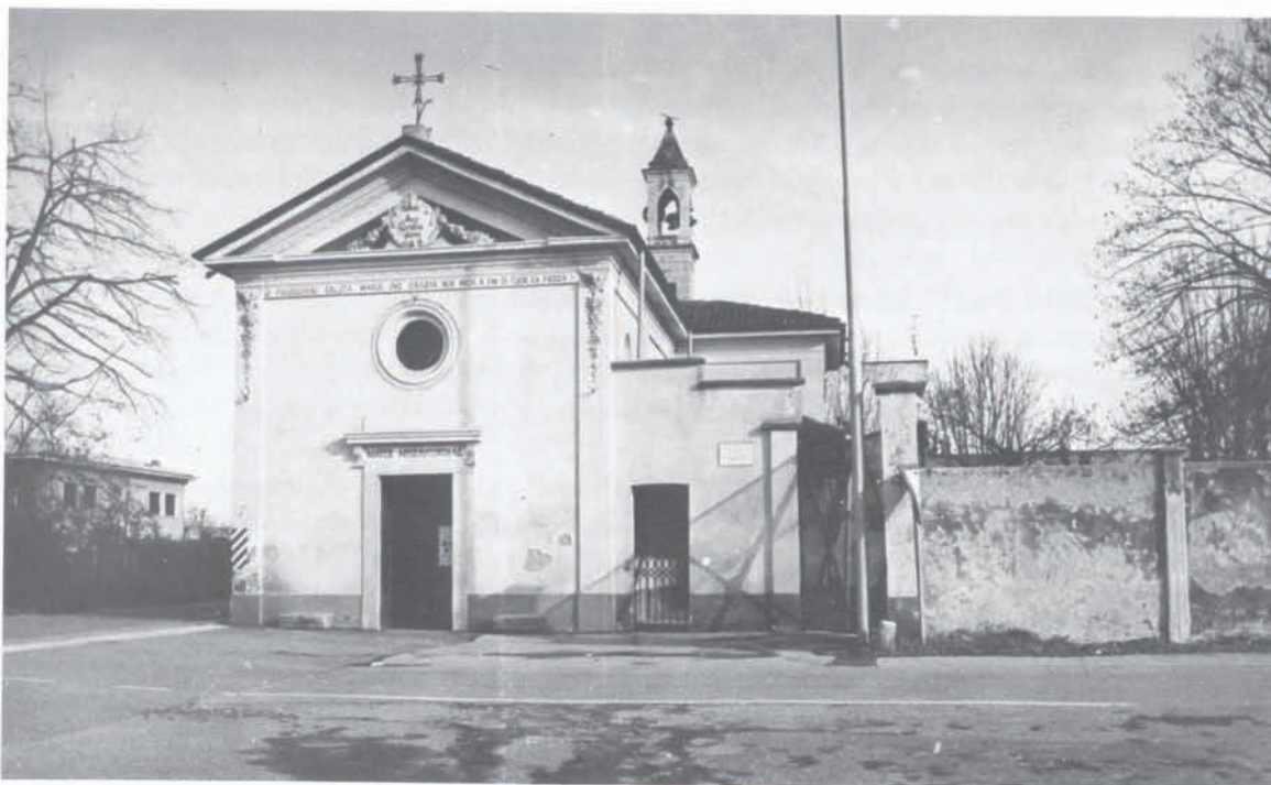
Santuario della B.V. Maria della Misericordia, oggi. Veduta esterna.

E così, dopo l'ampliamento avvenuto negli anni 1913/14, il Santuario verrà nuovamente ampliato dopo le ultime disposizioni inerenti anche se personalmente avrei preferito che questa testimonianza di fede, avuta dai nostri avi, fosse solo accuratamente restaurata e riportata alla bellezza della antichissima Chiesa campestre, voluta dai vedanesi di un tempo, per ringraziare la Beata Vergine della Misericordia. (una mia personale opinione questa, forse non condivisa dai più)