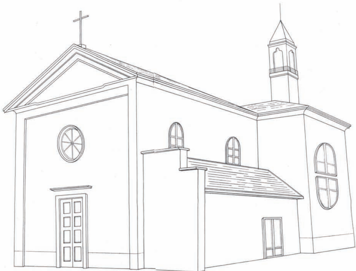
Santuario B.V. Maria della Misericordia dopo l'ampliamento. Veduta sud-ovest.

inscì che dopo avè adorà per on moment noster Signur, che sempar tanto bon el me stà a specià, pasientement, dedree del piccol üss in nascondon, fan nà bela cicciarada a la Madona, ghe porten nà candila longa a coeur avert, po' con tanto ben e pussee content, cont j ultim paroll de l'Ave Maria saluden el Signur e la sua Mader Pia e scapan via per riprend el trotà d'ogni dì.