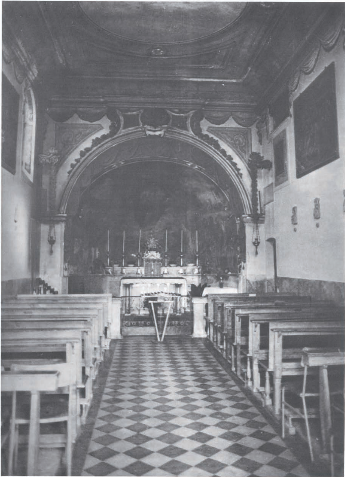
Santuario B.V. Maria della Misericordia, oggi. Veduta interna e prima dell'ampliamento.