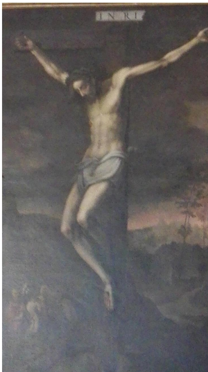
Crocefissione, quadro conservato nella nostra sacrestia, utilizzato per l'altare della Riposizione