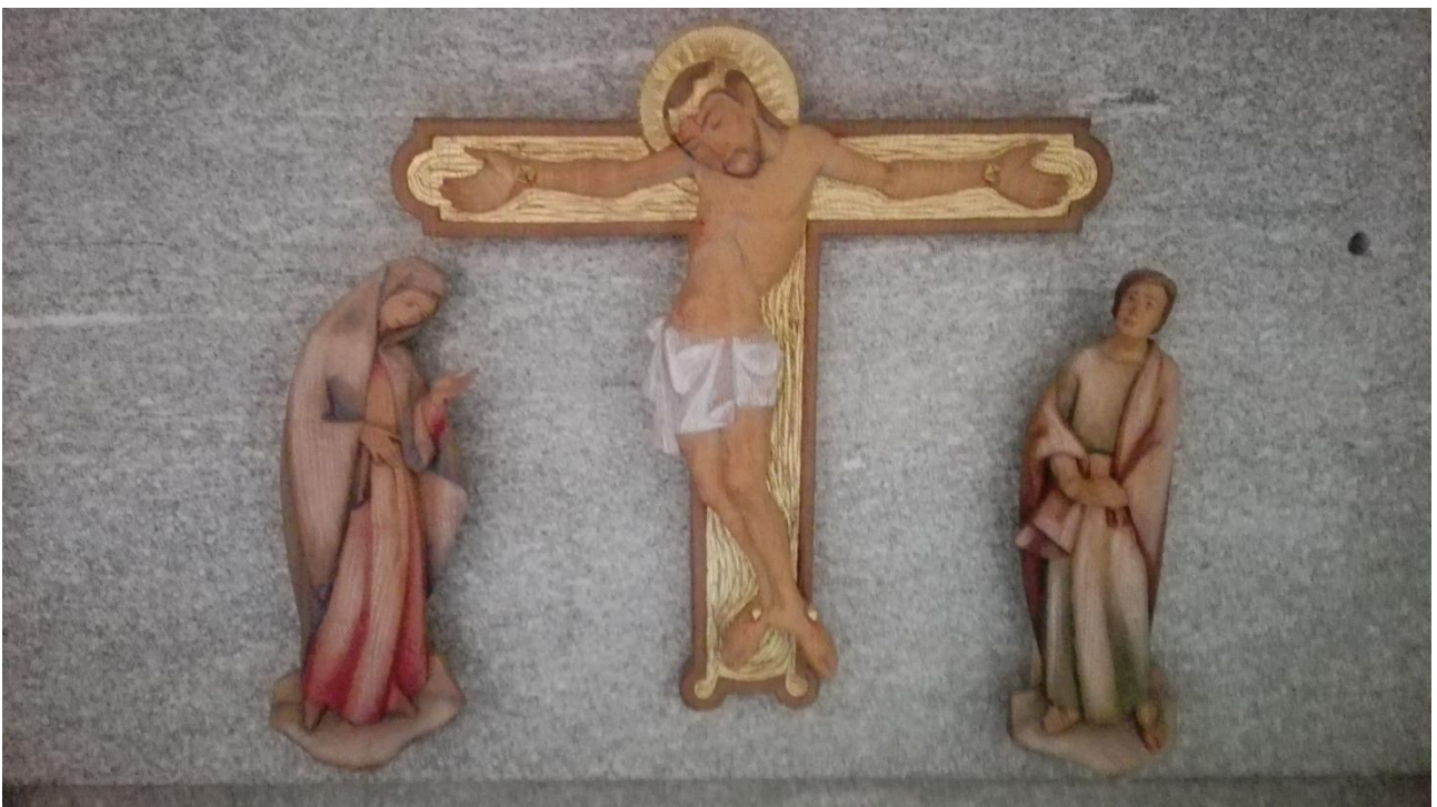
Crocefissione, particolare della mensa della nostra chiesa